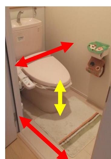
トイレ入口・内部