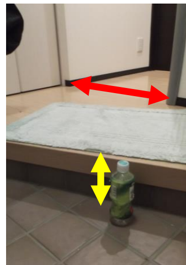
上がりかまち・廊下